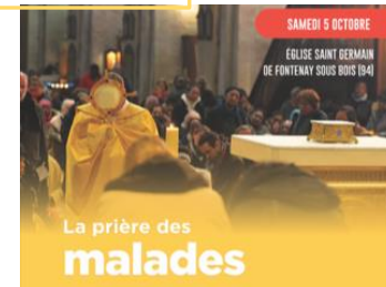
La prière des malades

Secrétariat téléphone 01 48 75 41 08 Lundi 9h-12h - Mardi 14h-17h - Mercredi 14h30-18h30